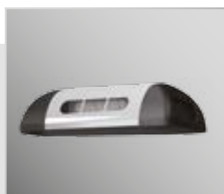
Оptionальный вентиляторный блок