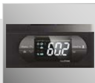
Встроенный контроллер с ЖК-дисплеем