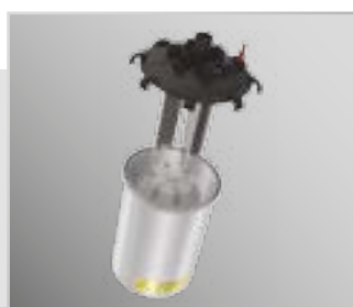
Сменный паровой цилиндр