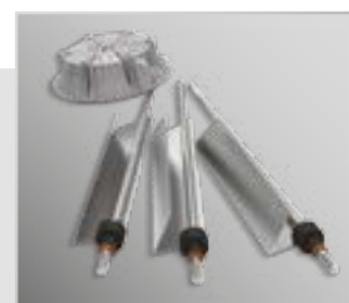
Электроды из нержавеющей стали